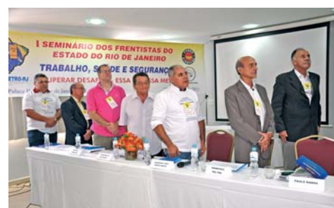
Abertura do seminário com políticos e sindicalistas.

Mais de cem trabalhadores de postos de combustíveis e lojas de conveniência participaram em agosto do 1º SEMINÁRIO DOS FRENTISTAS DO ESTADO , realizado pelo SINPOSPETRO-RJ. O seminário - SUPERAR DESAFIOS ESSA É A NOSSA META - teve como principal objetivo levar informação com relação a qualificação profissional para a categoria, destacando a importância dos eventos que vão acontecer no Rio de Janeiro como a Copa de 2014 e as Olimpíadas de 2016.