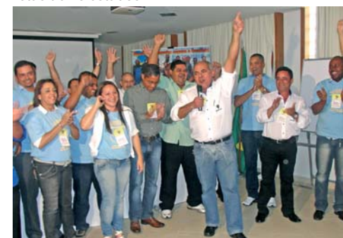
Encerramento com toda diretoria do SINPOSPETRO-RJ.