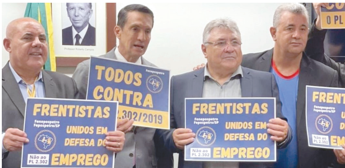
Dirigentes da categoria lutam em Brasília contra o autosserviço

Apesar da Lei 9.956/2000, que proíbe a instalação de bombas de autosserviço nos postos de todo o país, os dirigentes dos frentistas continuam lutando para manter os empregos da categoria. Há três projetos no Congresso Nacional que solicitam a revogação da lei.