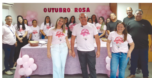
Conscientização Outubro Rosa

O SINPOSPETRO-RJ aderiu à campanha Outubro Rosa para conscientizar as trabalhadoras sobre os riscos de câncer de mama. A campanha se estendeu por todo o mês de outubro. Além de serem orientadas no ambiente de trabalho, as mulheres com mais de 45 anos realizaram exames na clínica conveniada ao sindicato. A campanha foi encerrada com uma reunião no sindicato.