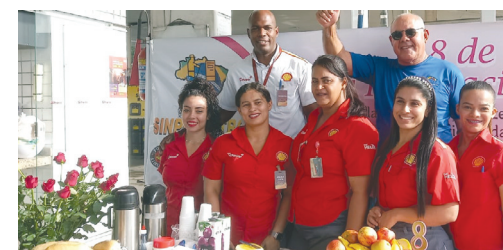
Café da manhã da mulher no Posto Amigão de Nova Iguaçu

O sindicato tem três mulheres em sua diretoria e atua fortemente contra as empresas que fornecem uniformes inapropriados para as trabalhadoras.