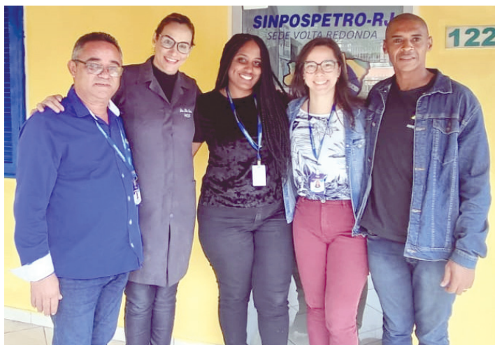
Equipe subseção de Volta Redonda

Os frentistas do Sul Fluminense contam com atendimento jurídico e dentário especializado, na subseção de Volta Redonda. O trabalhador pode entrar em contato pelos canais digitais para obter mais informações e esclarecer dúvidas sobre os seus direitos. As mensagens podem ser enviadas pelo WhatsApp 21 97075-7900 ou para o endereço eletrônico: juridico.subsedevr@sinpospetro-rj.org. O frentista também pode solicitar a presença de um diretor ao posto pelo telefone (24) 3348-4955.