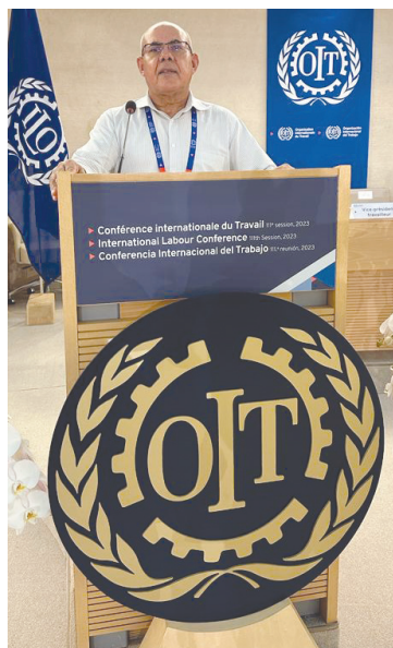
Conferência na OIT