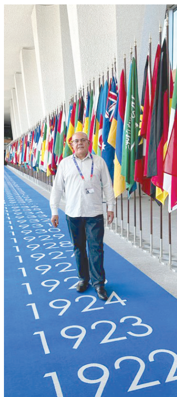
Presidente do SINPOSPETRO-RJ

“Foi muito importante participar destes dois eventos. Os frentistas estão ajudando a escrever a história do país. Este espaço foi conquistado com muita luta. Precisamos colocar a promoção e a justiça social no centro dos debates. Só haverá paz no mundo quando uma verdadeira justiça social for garantida aos trabalhadores”.